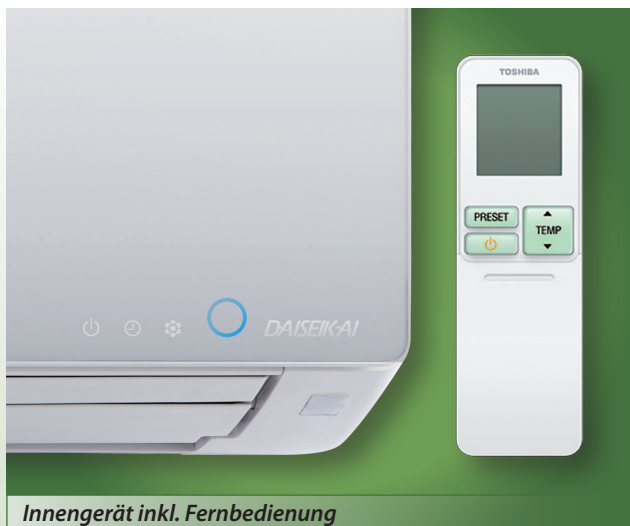
Innengerät inkl. Fernbedienung

Maximaler Komfort und beste Energieeffizienz haben einen Namen